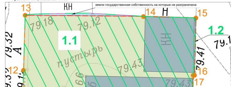
Фрагмент №1, масштаб 1:100

Примечания: 1. Чертеж разработан на основе инженерно-геодезических изысканий, выполненных МБУ "Нижегородгражданпроект" в 2021 г. 2. Система координат - ГСК 52.