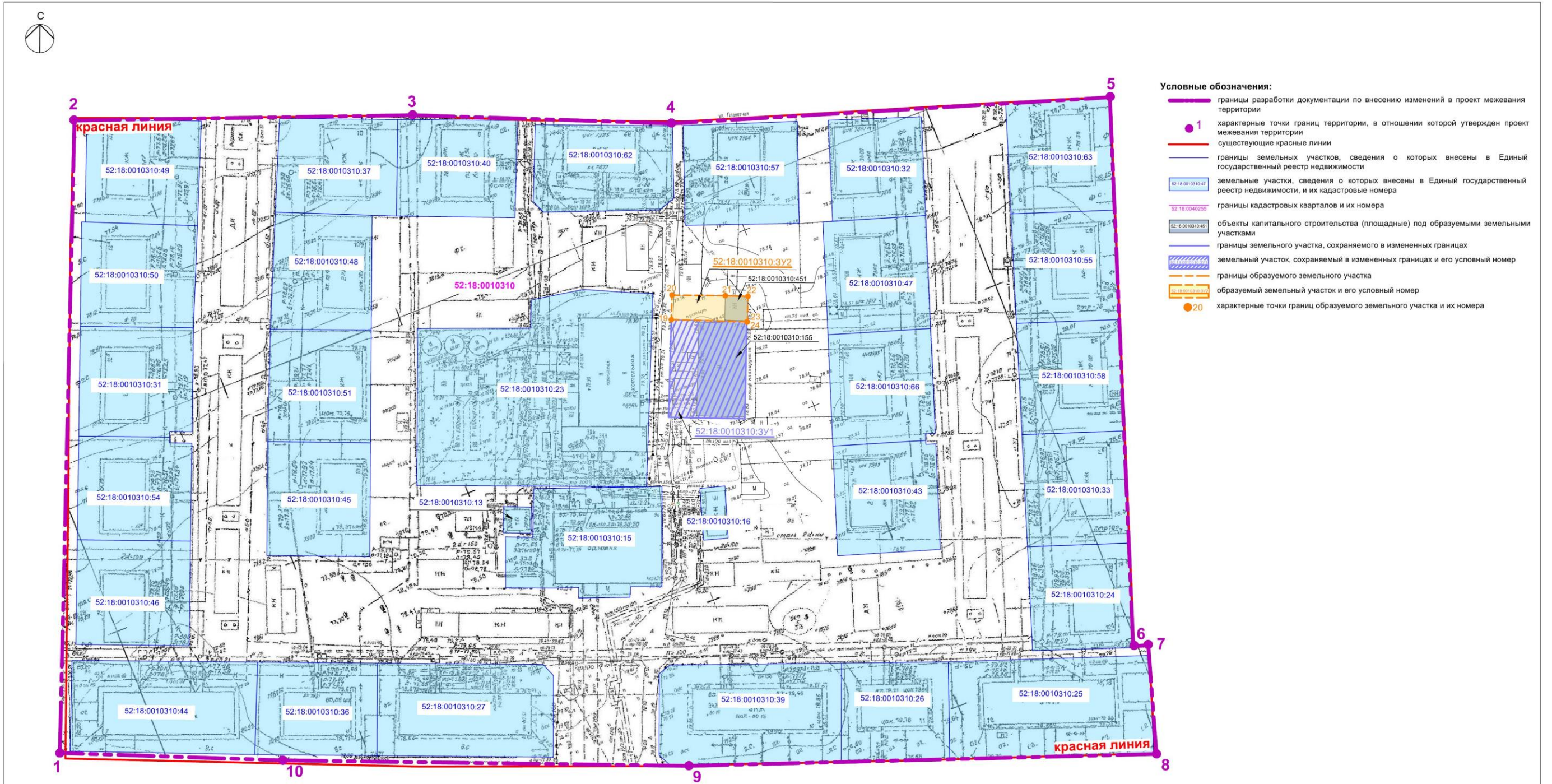
Экспликация образуемых земельных участков