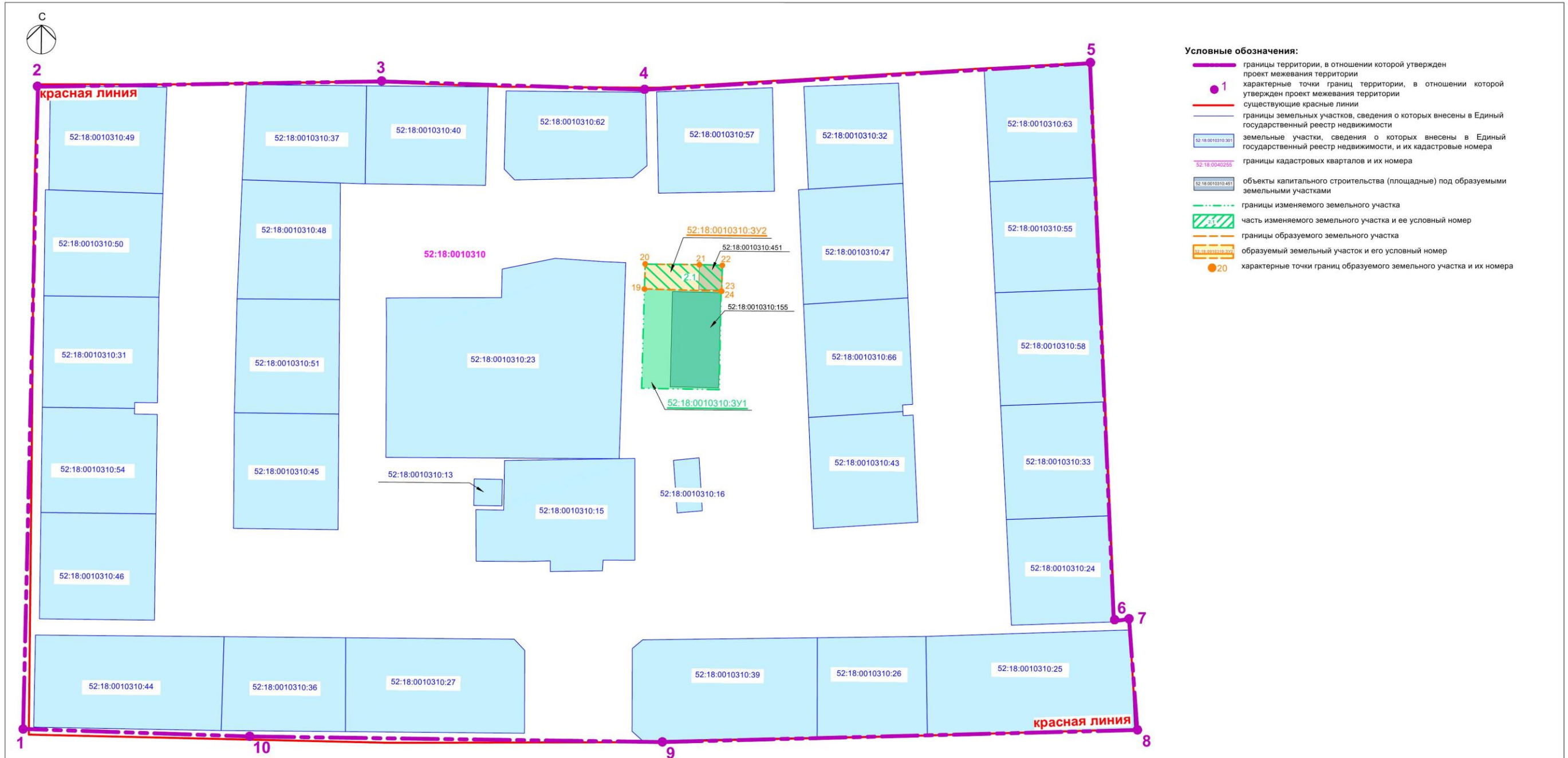
Экспликация образуемых и изменяемых земельных участков