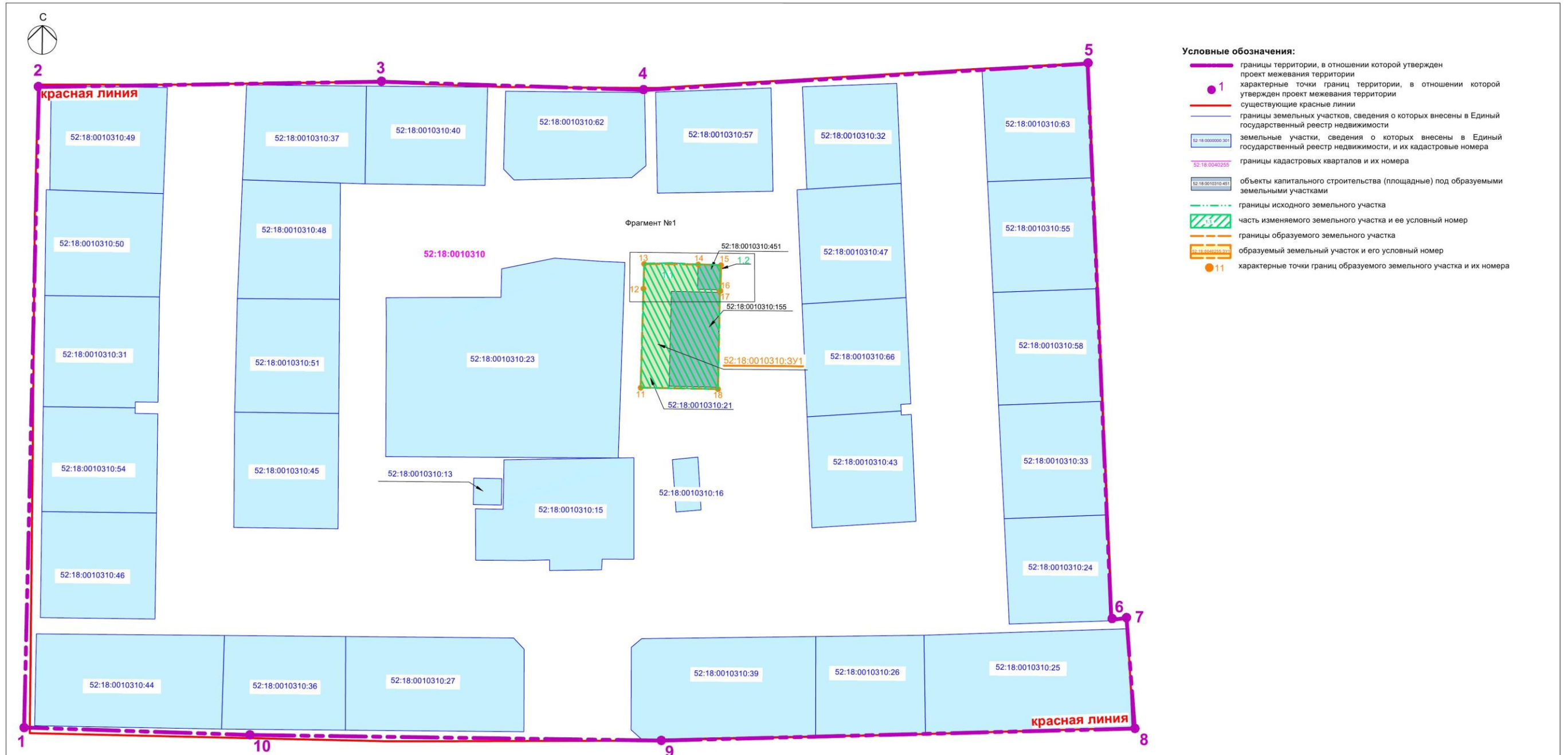
Экспликация образуемых и изменяемых земельных участков